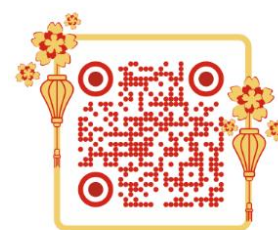
Застосунок для створення QR коду